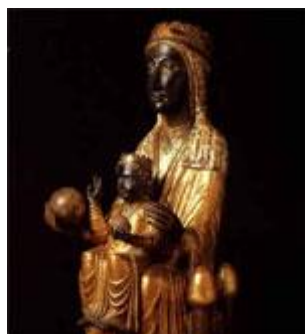
La Vierge Noire

→Ce weekend était placé sous le signe de l'art Moderniste (1880-1920) de Gaudí à Domenech i Montaner, 2 figures majeures de ce style architectural et décoratif particulièrement riche en Catalogne.