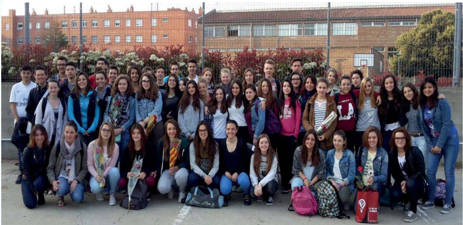
Photo souvenir – des pionniers ! – de l'échange avec l'Espagne en 2014.

NDLR : en raison d'une faille dans le continuum-espace-temps indépendante de notre volonté, l'échange "long" a déjà eu lieu au moment où nous publions ces lignes... Désolés.