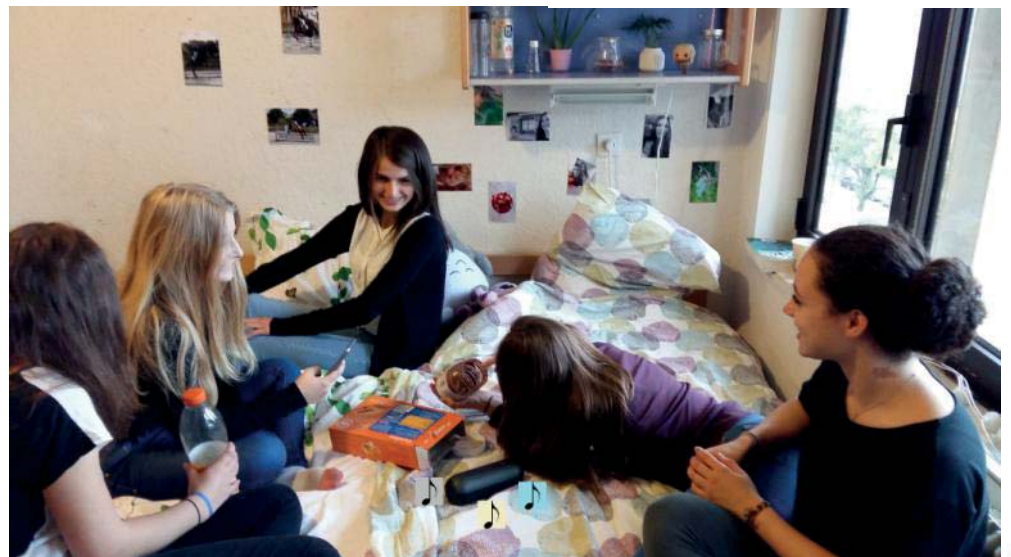
Chez les Filles : manger... et discuter