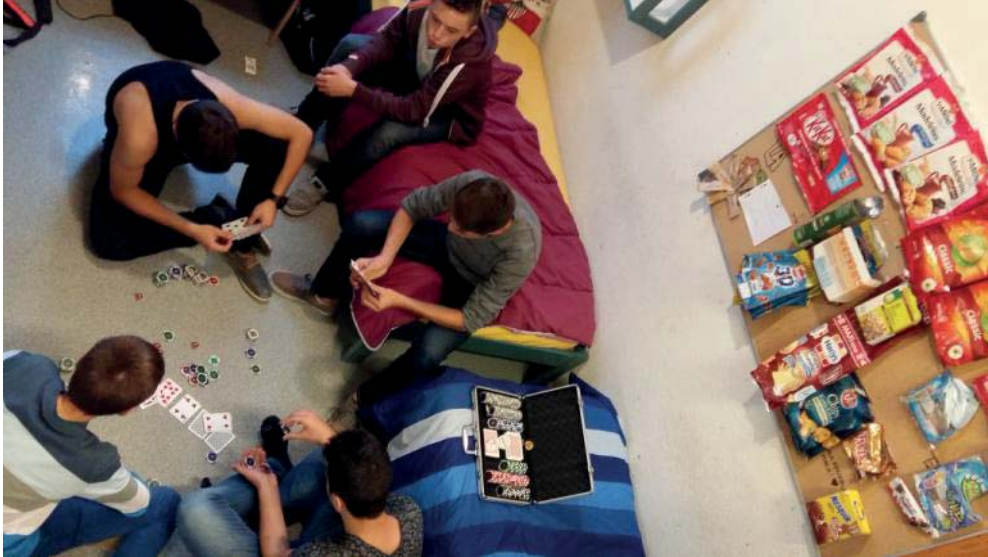
Chez les Garçons : manger... et jouer

Tout le monde se demande comment les secondes vivent la nouveauté de l'internat. Nous avons donc mené l'enquête pour avoir l'avis des filles, au deuxième étage, et des garçons, au premier.